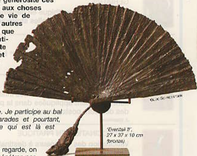
'Éventail II', 27 x 37 x 10 cm (bronze)

Clotilde Ancarani orchestre avec une belle générosité ces contradictions qui donnent de l'épaisseur aux choses vraies. Embarquée dans les galops d'une vie de femme, d'artiste, de mère, gourmandes des autres et d'elle-même, elle me fait penser à ce que disait Virginia Woolf dans un curieux texte intitulé "Une chambre à soi". J'en ai retenu cette nécessité des femmes, parfois, de mentir et de tricher avec l'espace et le temps pour se garantir la lenteur des gestations d'une oeuvre d'art à l'abri des autres, hommes et enfants d'abord.